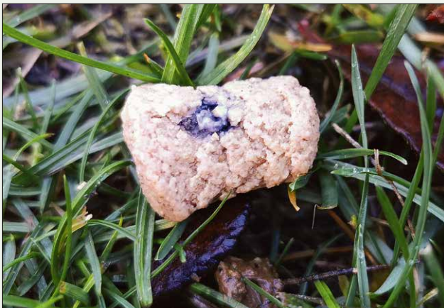
Giftköder mit Rattengift