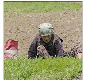
Eine Nordkoreanerin sammelt Gras, um daraus eine Mahlzeit zuzubereiten