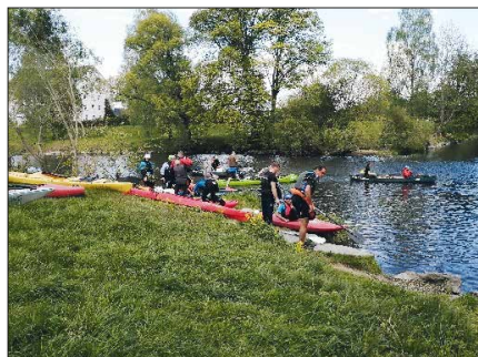
Am Zusammenfluss Zschopau – Flöha

So findet seit 1983 jährlich die Fahrt „Rechts und links der Augustusburg“ statt. Dieses Jahr waren auch wir als Arbeitsgruppe Ortsgeschichte dabei. Denn Geschichte ist schließlich nicht nur das, was einmal war, sondern auch das, was wir heute erleben.