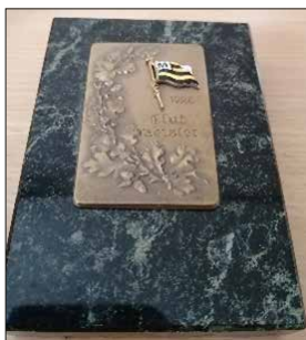
Clubmeister Pokal von 1928

Auch an verschiedenen größeren Wanderfahrten nahmen Vereinsmitglieder teil, die über Elbe, Rhein, Main, Donau, Mulde und sogar auf der Rhone bis zum Mittelmeer führten.