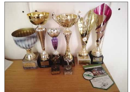
Trophäensammlung des Kanusportvereins

In verschiedenen internationalen Wettbewerben konnte unser Kanusportverein schöne Preise erringen.