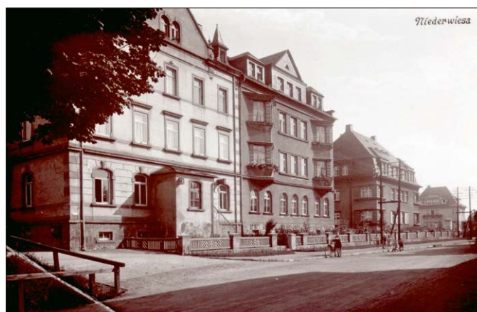
Postgebäude „Zum Bahnhof“ (Ansichtskarte aus dem Jahr 1937)

Ab dem 1. April 1899 befand sich das Postamt in dem neuerbauten Haus, dem alten Bahnhofsgebäude gegenüber. Seitdem wird der schmale Weg, der von hier zur Dresdner Straße führt, auch die Postgasse genannt.