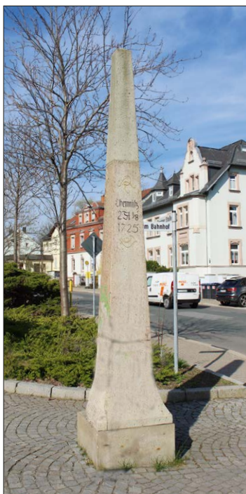
Postmeilensäule in Niederwiesa beim Rathaus

Diese Postlinie wurde mit Postkutschen jeweils montags und sonnabends befahren.