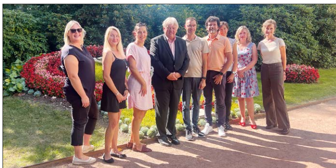
Auf dem Bild sind einige Teilnehmer der Veranstaltung vor der Hainichener Blumenuhr im Stadtpark zu sehen.

Pünktlich zum Treffen wurde der gemeinsam erstellte Flyer zum Tag des offenen Denkmals 2024 geliefert. Dort wurden die Veranstaltungen in den drei Orten vom 06. bis 08.09.2024 gemeinsam vorgestellt. Der Flyer ist ab sofort in den Rathäusern und darüber hinaus erhältlich.