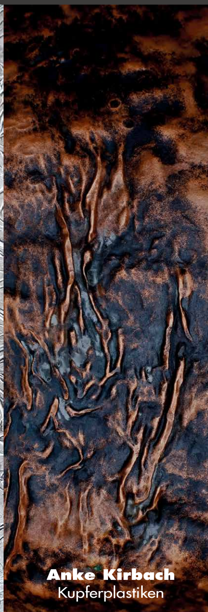
Anke Kirbach Kupferplastiken