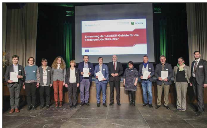
Ernennung der LEADER-Gebiete am 1. März 2023 in Limbach-Oberfrohna

Antragsberechtigt sind unter anderem Privatpersonen, Unternehmen, Religionsgemeinschaften, Kommunen und Vereine. Die Fördersätze je nach Maßnahme betragen zwischen 30 % und 80 %, wobei sowohl Förderhöchstbeträge als auch der räumliche Geltungsbereich eine Rolle spielen. So sind bauliche Maßnahmen in den Stadtgebieten von Flöha, Frankenberg, Marienberg, Olbernhau und Zschopau nicht förderfähig. Alle anderen zwölf Kleinstädte und Gemeinden sind vollumfänglich förderfähig.