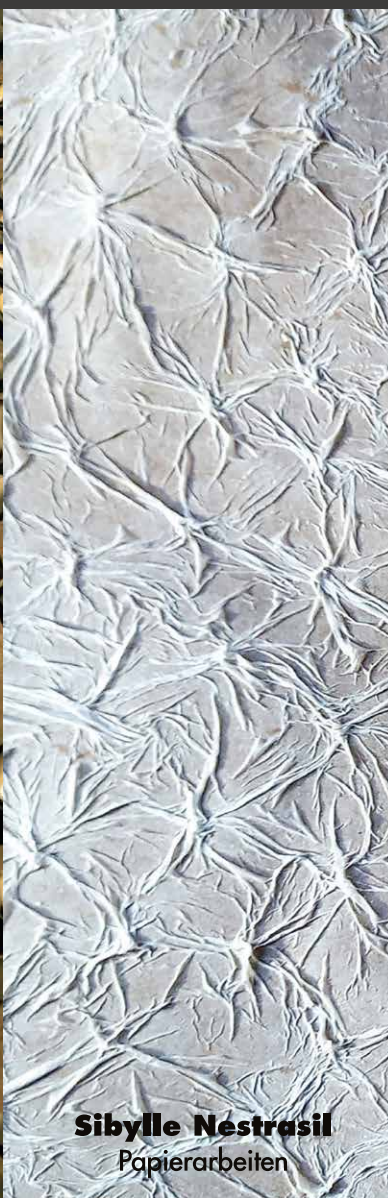
Sibylle Nétrasil Papierarbeiten