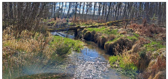
Foto: Ein naturnahes Gewässer mit unterschiedlichem Bewuchs bietet eine große Vielfalt für Lebewesen, aber auch zur Erholung.

Wie sollte der Bach in meiner Heimat überhaupt aussehen? Manche denken jetzt vielleicht an ein gerades Gewässer, der Böschungsrasen kurz gemäht. Doch so einem Gewässer geht es nicht gut. Naturnahe Gewässer dagegen erfüllen viele Funktionen. Sie sind Lebensraum, sorgen innerorts für Abkühlung an heißen Tagen und sind für Hochwasser gut gewappnet. Denn mit ihren kräftigen Wurzeln halten standortgerechte Gehölze am Gewässer das Ufer fest und verhindern, dass es ausgespült