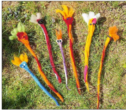
Im Leseclub gefilzte Bücherwürmer.

Schülerinnen und Schüler ab 10 Jahren waren außerdem in den Sommerferien eingeladen, ausgerüstet mit Bücherbeutel und LesePASS, am alljährlichen Buchsommer teilzunehmen.