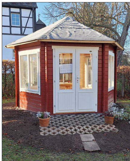
Der neue Pavillon im Bibliotheksgarten

Anlässlich des Tages der Bibliotheken am 24. Oktober lagen auch im letzten Jahr