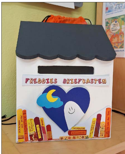
Das Bibliotheksgespent Freddie freut sich über Post.

Mit einer Schnitzeljagd durch Niederwiesa lockte das Bibliotheksgespent Freddie Kinder in den Sommermonaten zum Lesen, Rätseln und Entdecken in die Bibliothek. Den krönenden Abschluss bildeten die Überraschungen, die alle Kinder, die Freddie Hinweise entschlüsselt hatten, für ihre Mühe erhielten. Seit Oktober hat das Bibliotheksgespent Freddie einen eigenen Briefkasten in der Bibliothek und freut sich über Post.