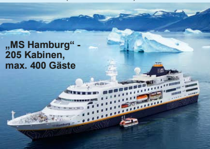
„MS Hamburg“ - 205 Kabinen, max. 400 Gäste