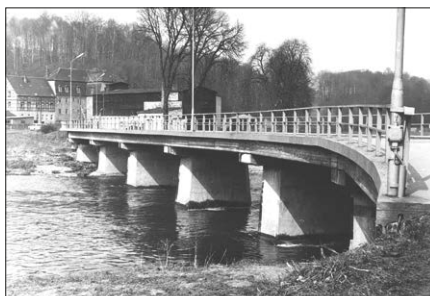
„Fünfer-Brücke“ und Mühle 1972

Um ans andere Ufer zum Harrasfelsen (Haustein) zu gelangen, überqueren wir die Zschopau. Wir gehen den Weg wieder zurück und nutzen dafür die „Fünfer-Brücke“.