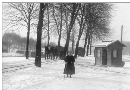
Brücke über die Zschopau mit Pferdebahn und Zollhäuschen

Als 1869 in Braunsdorf der Bahnhof in Betrieb genommen wurde, bedurfte es einer ständigen Verbindung über die Zschopau. Es wurde 1870 ein einfacher Holzsteg errichtet. Bereits zwei Jahre später wurde eine Privatbrücke vom Mühlenpächter errichtet, auf welcher Feldbahngleise verlegt waren. Die beladenen Loren wurden von zwei Pferden gezogen.