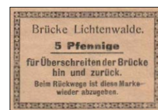
Brückenpassierschein 5 Pfennige

Kassiert wurde viele Jahre lang im „Brückenhäusel“ vom „Brückengustl“ (Auguste Hofmann).