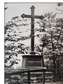
Körner-Kreuz auf dem Harrasfelsen

Der Sockel weist folgende Inschrift auf: „Dem Sänger und Helden Theodor Körner Die Bewohner von Frankenberg Zur Erinnerung an den 26. August 1863“