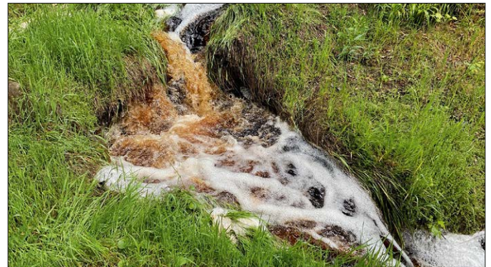
Eine natürliche Schaumbildung kommt beispielsweise bei Bächen aus Mooregebieten wie hier im Erzgebirge vor und ist nicht bedenklich.

Dieser Text entstand in Zusammenarbeit der Fachberaterinnen und Fachberater Gewässer des Landesamtes für Umwelt, Landwirtschaft und Geologie und der unteren Wasserbehörde des Landkreises.